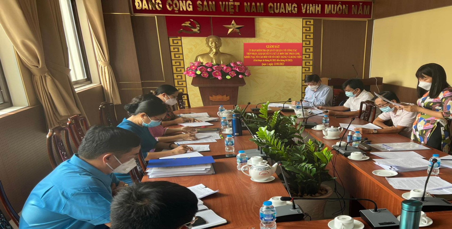
Giám sát cơ quan Ủy ban Kiểm tra Quận ủy