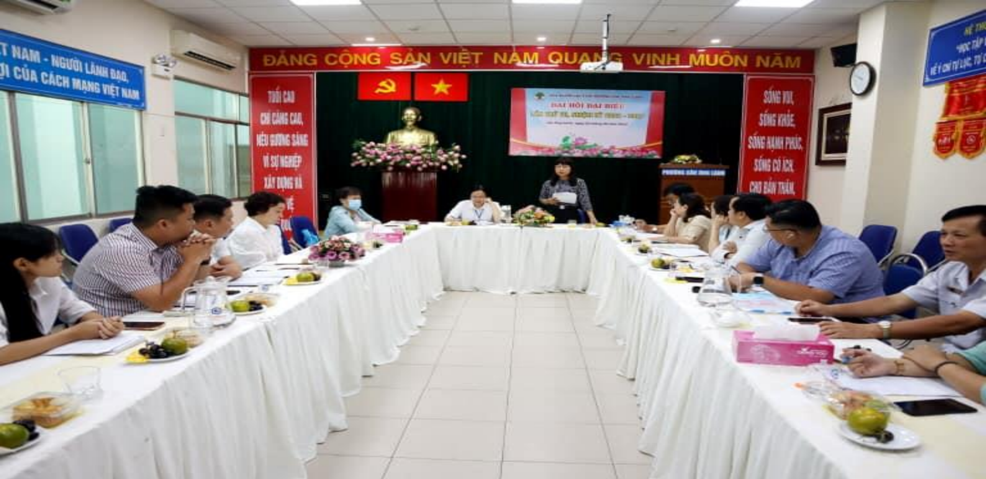
Giám sát Phó Bí thư – Chủ tịch UBND Phường Cầu Ông Lãnh