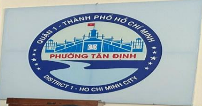
Giám sát Đảng ủy Phường Tân Định

"VIỆC GÌ CÓ LỢI CHO DÂN PHẢI HẾT SỨC LÀM, VIỆC GÌ CÓ HẠI CHO DÂN PHẢI HẾT SỨC CHỐNG" HỒ CHÍ MINH